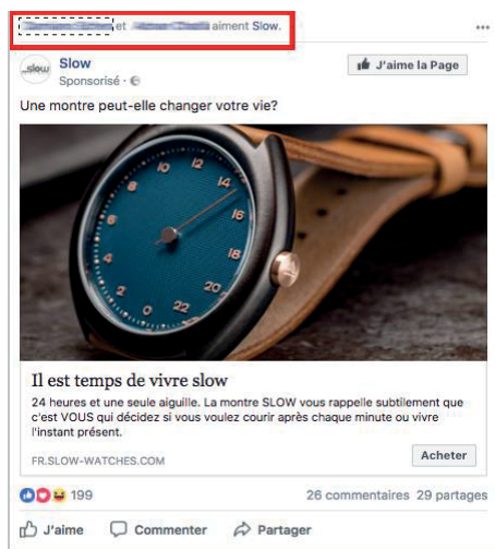
(6) La publicité Slow

Slow finance une publicité Facebook qui propose approximativement les mêmes modalités que celle de l'école Ceruleum : c'est-à-dire du texte, une image, la possibilité d'aimer la page et celle d'accéder au site officiel de la marque, cette fois-ci en cliquant sur l'image. Par cet exemple, nous allons réfléchir au rôle qu'exerce une communauté d'amis Facebook sur la réception de la publicité par l'utilisateur.