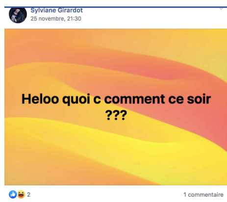
Image 2 : demande d'information sur la localisation des contrôleurs

De tels messages théoriquement interdits sont si fréquents qu'ils en deviennent une norme, au-delà des règles générales. Il est donc pertinent d'insister ici sur l'aspect auto-générateur et auto-décisionnel implicite qui se met en place : les règles d'une communauté s'établissent par les comportements des membres au fil du temps, autant que par les règles qui la constituent. Considérons les aspects linguistiques de cette 'constitution'.